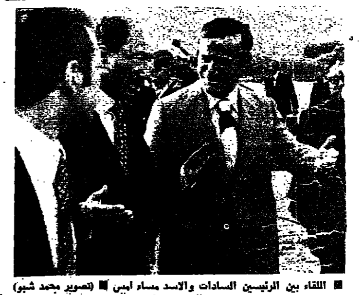
اللقاء بين الرئيسين السادات والاسد مساء امس